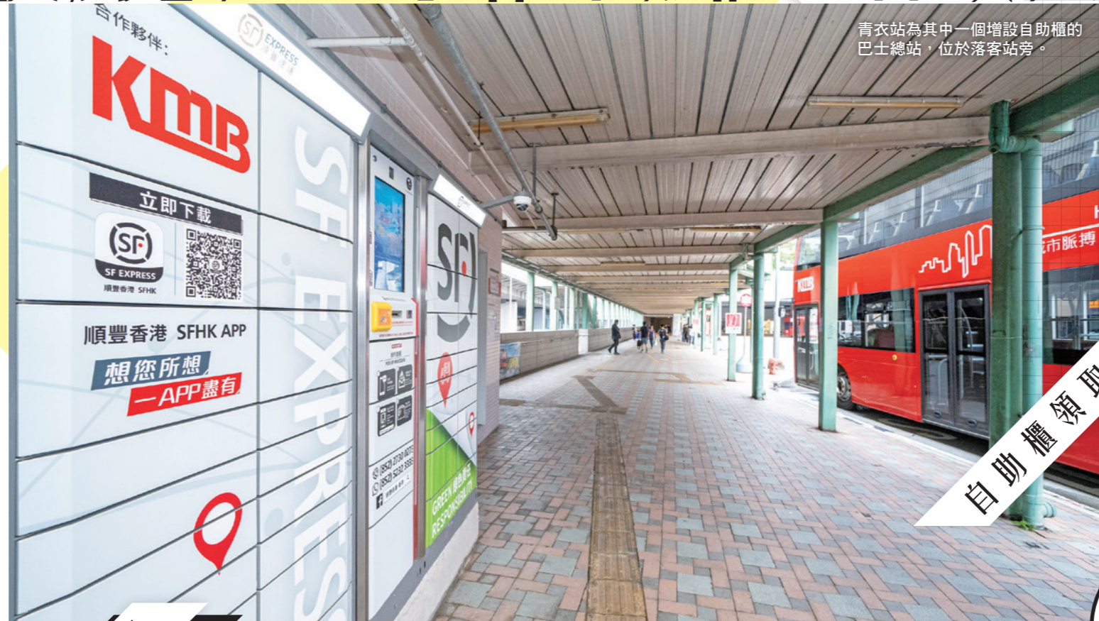
青衣站為其中一個增設自助櫃的巴士總站，位於落客站旁。

首創自助櫃領失物服務 輕鬆便利乘客 除了領取包裹，九巴更創先河首設自助櫃領取失物服務。乘客如不幸在巴士車廂遺失物品，除了親臨九巴九龍灣車廠認領，亦可以選擇於各個設有自助櫃的巴士總站領取，輕鬆又方便。