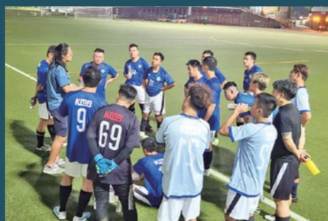
▲九巴足球隊於比賽前積極備戰。

九巴致力創造條件，讓員工培養身心健康的生活習慣和文化，設有十個興趣會，包括歌唱、棋藝、攝影、籃球及跑步等不同範疇，動靜皆宜，更會不時與友好企業舉辦活動和友誼賽，一起切磋交流，並擴闊社交圈子。