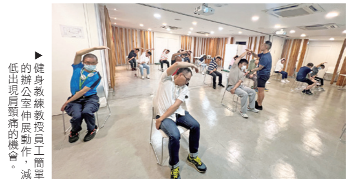
健身教練教授員工簡單的辦公室伸展動作，減低出現肩頸痛的機會。

除了保持心靈健康外，身體健康同樣重要。有同事經常坐著工作容易頸梗膊痛，九巴特設「辦公室伸展班」，安排健身教練教授簡單的辦公室伸展動作，拉鬆肌肉，舒緩肩頸痛的問題。