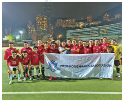
▲九巴足球隊於行際康樂體育會十一人足球勇奪亞軍。

九巴足球隊最近參與由行際康樂體育會舉辦的十一人足球比賽，表現出色，在九支企業隊伍中奮力作戰，經過多場緊張刺激的比賽，憑藉足球隊各位同事的堅持及努力闖入決賽，最後奪得亞軍，為九巴爭光！