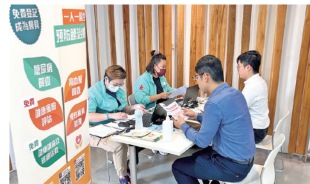
參加者登記參加即場身體檢查，由註冊護士測量體重指標、血脂和血壓，並解釋結果。