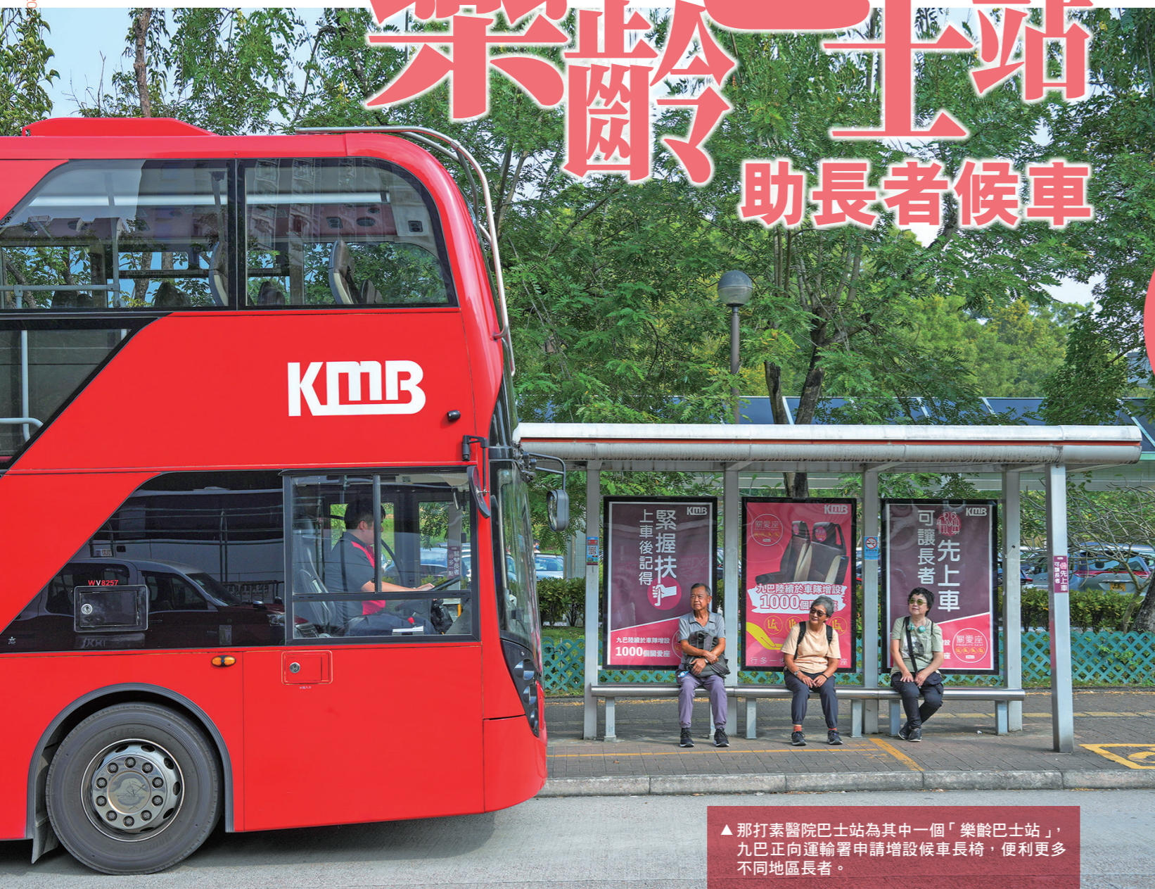
▲那打素醫院巴士站為其中一個「樂齡巴士站」，九巴正向運輸署申請增設候車長椅，便利更多不同地區長者。

社會近年提倡建設樂齡社區，透過不同長者友善措施讓老友記生活得更為便利。九巴作為深受長者歡迎的出行交通工具，全力支持這個理念，不時推出新舉措關愛銀髮一族，最新選定七十個長者使用率較高的巴士站或總站作為「樂齡巴士站」，向當局申請加設候車座椅，同時會增設千個車廂內的關愛座，讓更多有需要人士可以使用。十一月十九日長者日當日，九巴亦會繼續向全港長者提供免費乘車優惠，六十五歲或以上的長者當日可以免費乘搭任何九巴或龍運班次暢遊香港。