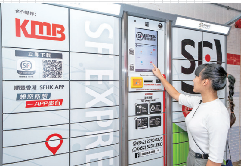
▲乘客領取失物時，要先輸入取件編號及付款。

香港人生活講求速度，九巴近日與速遞公司順豐香港合作，在巴士總站裝設自助櫃，更創先河新增自助櫃領取失物服務，不論領取快遞包裹或失物，只要乘巴士回家，順道到巴士總站的自助櫃取件便可，輕鬆又方便！