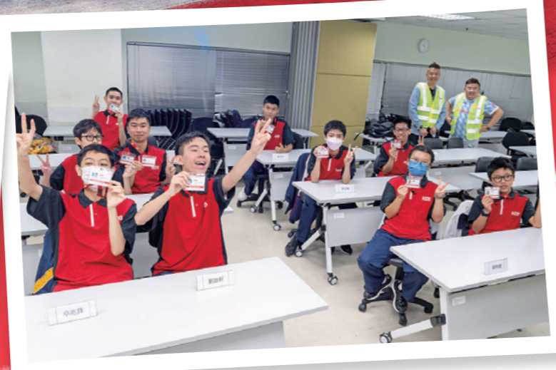
▲九巴學院特別為學生預備車長制服及學生工作證，滿足他們成為車長的願望。

體驗課程當日，十位來自中華基督教會基順學校和炮台山循道衛理中學的學生一早來到九巴學院，他們披上車長制服，佩戴印有相片及姓名的九巴員工證，並獲發一張車長名牌，搖身一變成為九巴準車長。