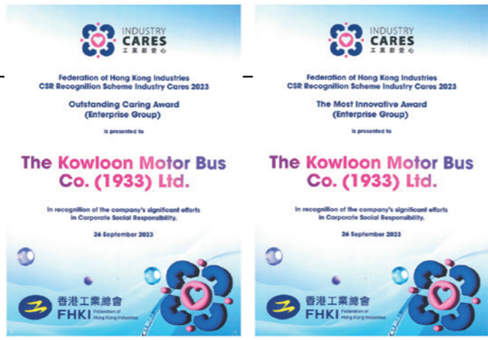
九巴榮獲「工業獻愛心」表揚計劃2023「卓越關懷大獎」及「最具創意獎」。

在員工方面，九巴主張平等就業、關愛共融，除了主動聘請傷健、非華裔和退休人士，九巴又與匡智會合作，為有特殊學習需要學生提供實習平台，如員工咖啡室Café1933就為他們提供餐飲實習機會，一展所長。環保方面，九巴的「2040願景」、電動巴士及太陽能巴士車隊等都為香港邁向碳中和作出重要貢獻，以實際行動領先業界。九巴將繼續努力履行社會責任，利用自身優勢回饋社會。 文：林苑均