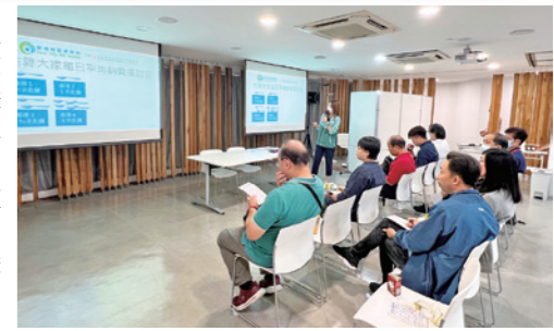
驗身講座由註冊營養師向參加者講解健康飲食習慣。

九巴更為同事安排驗身講座，設有即場健康諮詢和身體檢查，由註冊營養師講解健康飲食習慣及輕鬆保持身體多項標準達標的秘訣，並由註冊護士為同事進行身體檢查，測量各種健康指標及解釋結果。同場亦有攤位遊戲，讓同事從歡樂氣氛中學到實用健康資訊。 文：林苑均