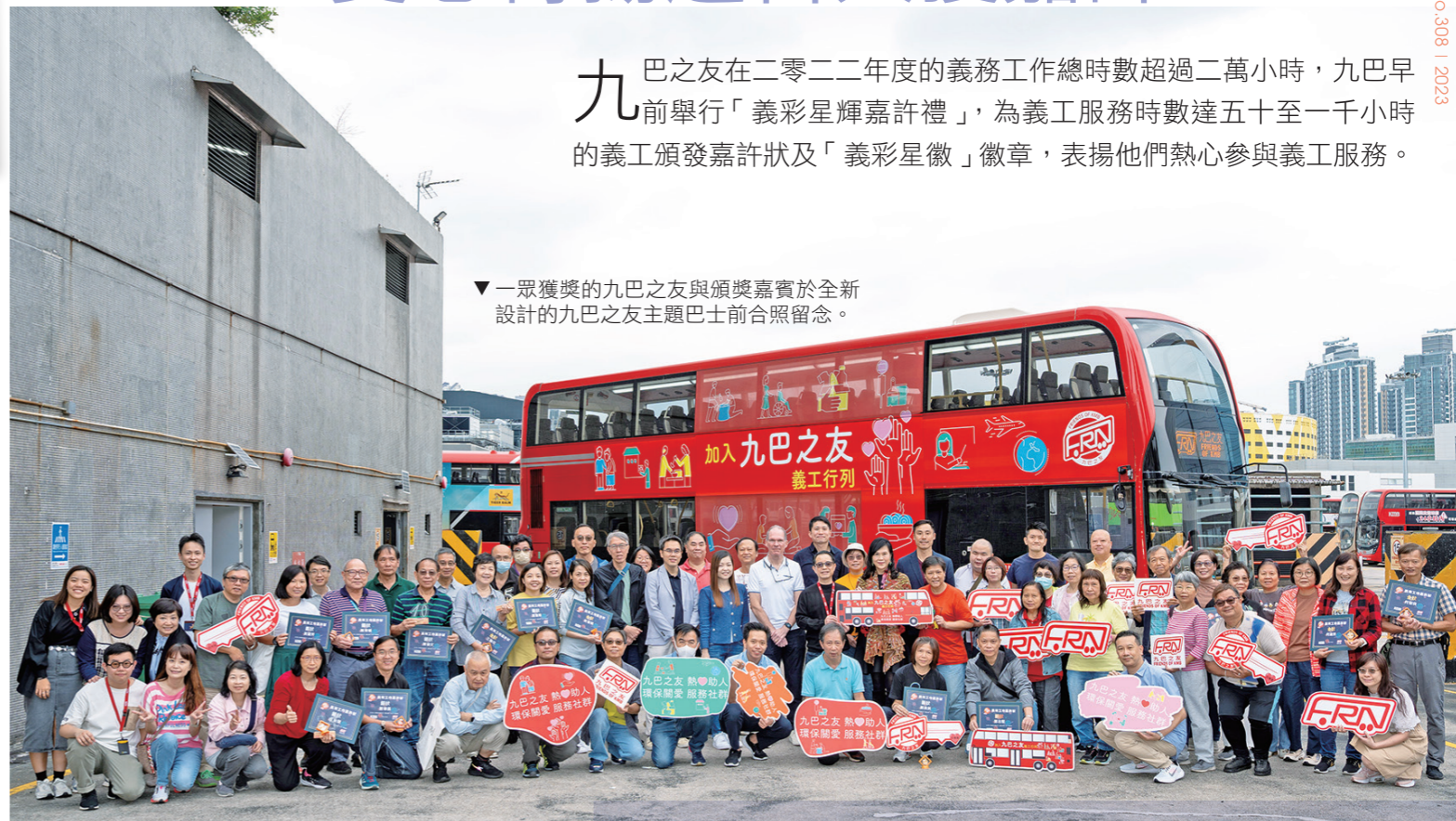
▼一眾獲獎的九巴之友與頒獎嘉賓於全新設計的九巴之友主題巴士前合照留念。

九巴之友在二零二二年度的義務工作總時數超過二萬小時，九巴早前舉行「義彩星輝嘉許禮」，為義工服務時數達五十至一千小時的義工頒發嘉許狀及「義彩星徽」徽章，表揚他們熱心參與義工服務。