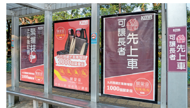
▲每個「樂齡巴士站」都貼有標語，提醒市民多點關愛長者及先讓有需要人士上車。

除了增設長椅，九巴同時會在這些樂齡巴士站貼上特製標語，提醒候車乘客要多點關愛長者和有需要人士，可以的話先讓他們上車，亦同時提醒乘客在上車後要緊握扶手。