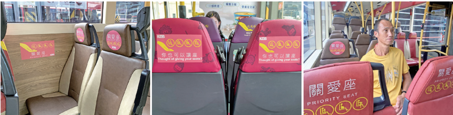
▲新增關愛座以豆沙色貼紙區分，分別貼於車廂旁邊及座位頭枕的正面及背面。

關愛長者又豈止於巴士站內？九巴早於二零一一年率先推出「關愛座」，每部巴士都設有四張關愛座，座椅頭枕均有「關愛座」字樣，以搶眼的黃色配上長者、孕婦、嬰兒和傷健人士等讓座對象的圖案，較新型號的巴士及電動巴士更設有六張關愛座。