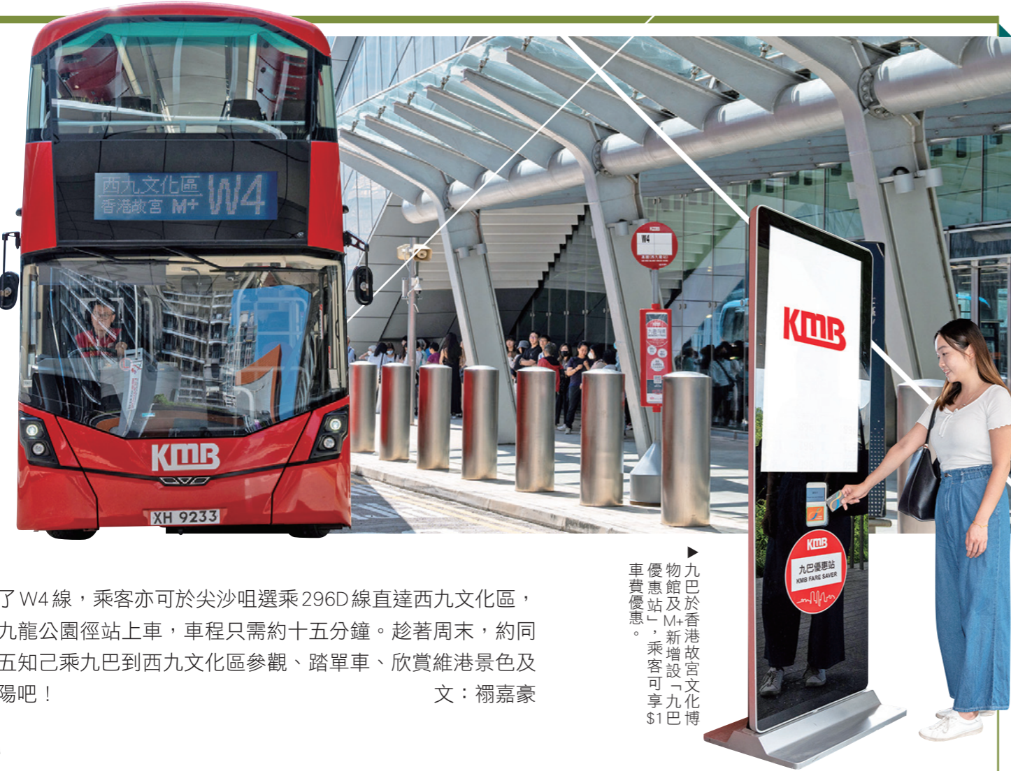
九巴全新路線 W4 方便乘客遊歷西九文化區。

除了 W4 線，乘客亦可於尖沙咀選乘 296D 線直達西九文化區，由九龍公園徑站上車，車程只需約十五分鐘。趁著周末，約同三五知己乘九巴到西九文化區參觀、踏單車、欣賞維港景色及夕陽吧！ 文：榻嘉豪