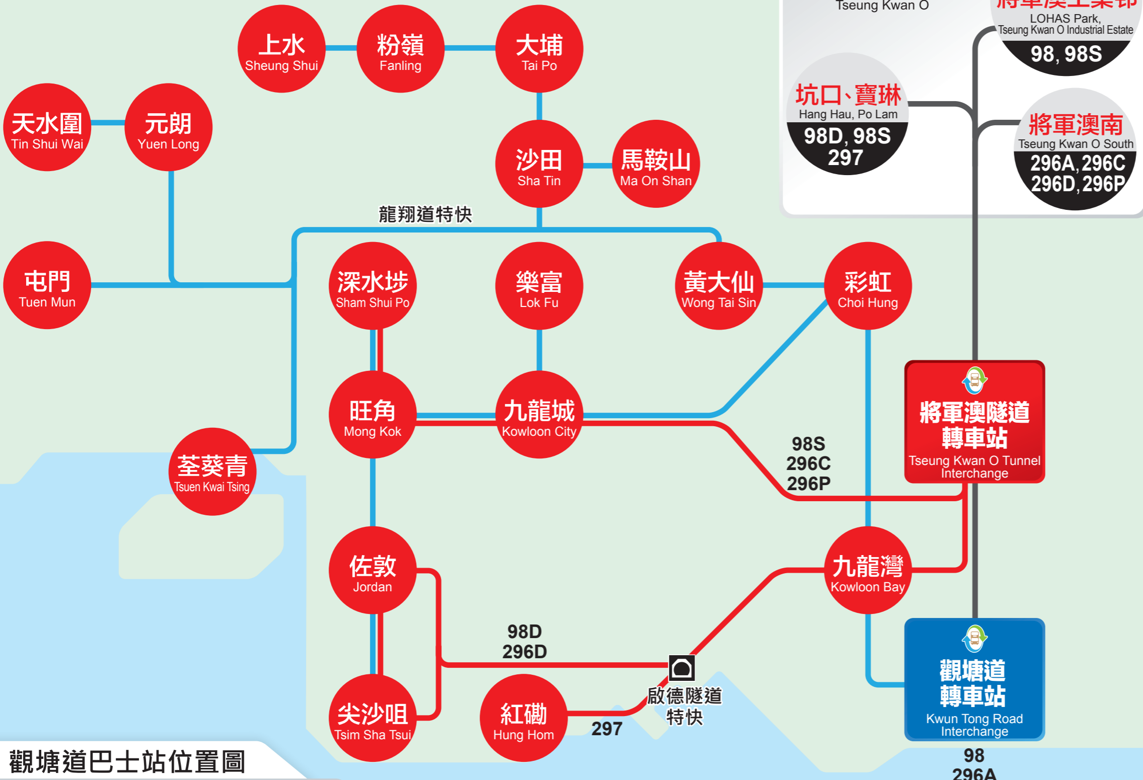
觀塘道巴士站位置圖